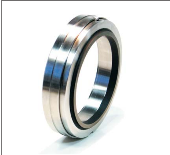
Abbildung ohne Gegenring